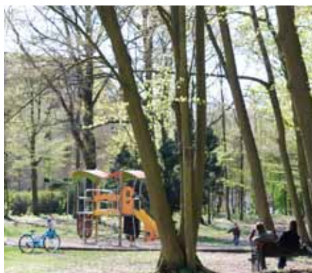
Aire de jeux du Parc Jean Vilar

2011 verra le déploiement du dispositif de vidéoprotection sur la commune de Saint-Michel-sur-Orge. Cette installation répond à plusieurs objectifs : la prévention des atteintes à la sécurité des personnes et des biens ; la protection des bâtiments et installations publiques et de leurs abords ; la régulation du trafic routier ; la constatation des infractions aux règles de circulation ; l'aide à la justice dans la recherche de preuves suite à un acte délictueux. Il s'agira de mettre en place 13 caméras dont 11 dômes mobiles et 2 fixes sur l'ensemble de la commune.