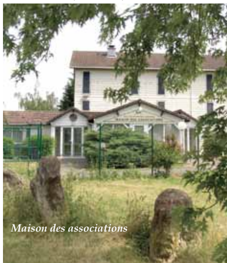
Maison des associations