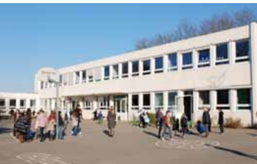
école Pablo Picasso