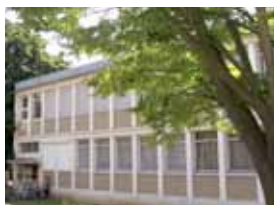
école du Parc de Lormoy

La première pierre de l'Espace Culturel sera posée dans le courant du mois d'avril. Cet équipement réunira la salle des fêtes et le conservatoire. Les 2 700 000 € correspondent à la somme engagée pour la réalisation de la première phase des travaux prévus en 2011.