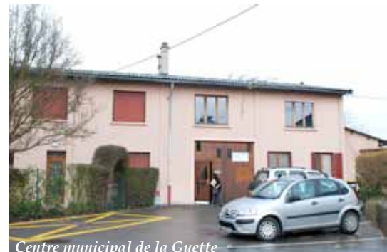
Centre municipal de la Guette

Aménagement des équipements administratifs