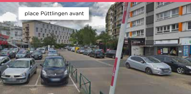
place Püttlingen avant